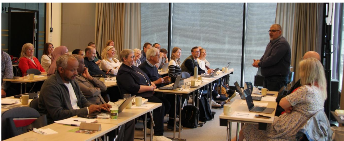
Årsmøte i K-stud 2025

K-stud, og de fleste andre studieforbundene, bruker tilskuddsportalen eApply levert av Solea, og vi er med i en arbeidsgruppe for å utvikle dette systemet. Målet er at det skal bli enklest mulig for søkerne våre å sende søknad. For å gjøre tilskuddsordningene mest mulig forutsigbare for brukerne, behandles søknadene løpende, og med utbetaling flere ganger i året. Vi legger vekt på enklest mulige søknadsprosedyrer, og forholder oss til minstekravene i voksenopplæringsloven for dokumentasjon av opplæringen.