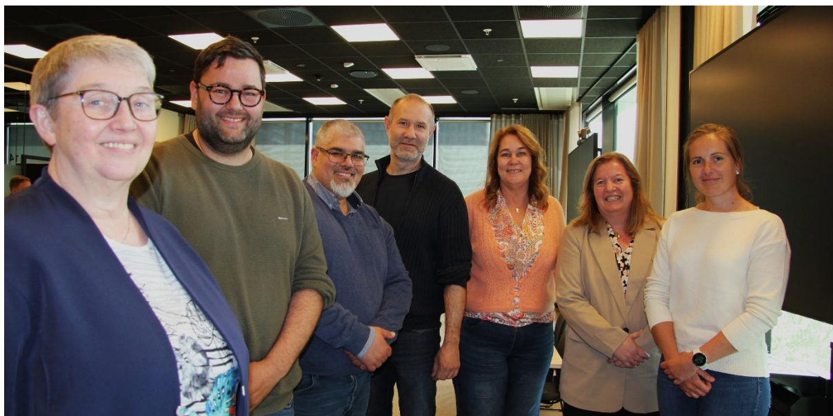
Deler av styret i K-stud 25/26

Styret legger til grunn at det er forutsetninger til fortsatt drift.