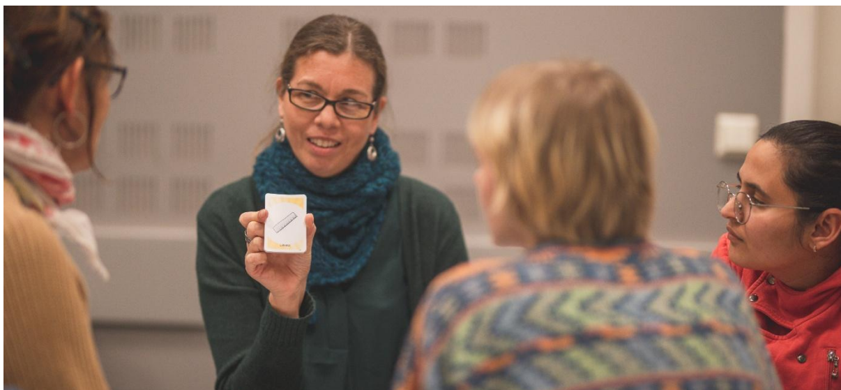
Norskurs i Salem i Bergen