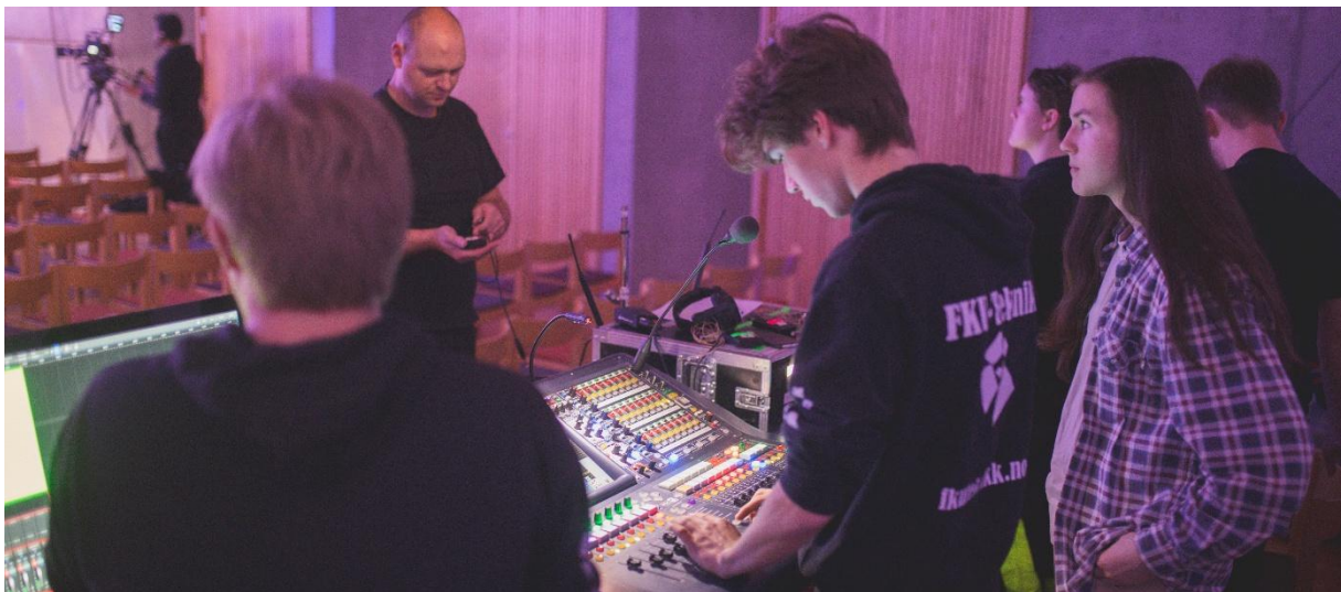
Kurs i lyd og lys i Fana og Ytrebygda menigheter

Vi har også deltatt med innspill på KrF sitt årlige kontaktmøte med toppledere for kristne organisasjoner og kirkesamfunn.